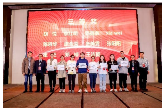
荻硕贝肯-湖北省暨武汉免疫学会年度优秀学术成果竞赛获奖名单

4月8日上午，首先召开了湖北省免疫学会第十一届理事会会员代表大会。湖北省民政厅钱华志处长，湖北省免疫学会第十届理事会的各位理事和来自湖北省各地的会员代表共计四百余人出席了大会。大会应到会员代表570人，实到会员代表402人，超过应到会员代表人数的三分之二，满足换届选举代表人数要求，会议合法有效。