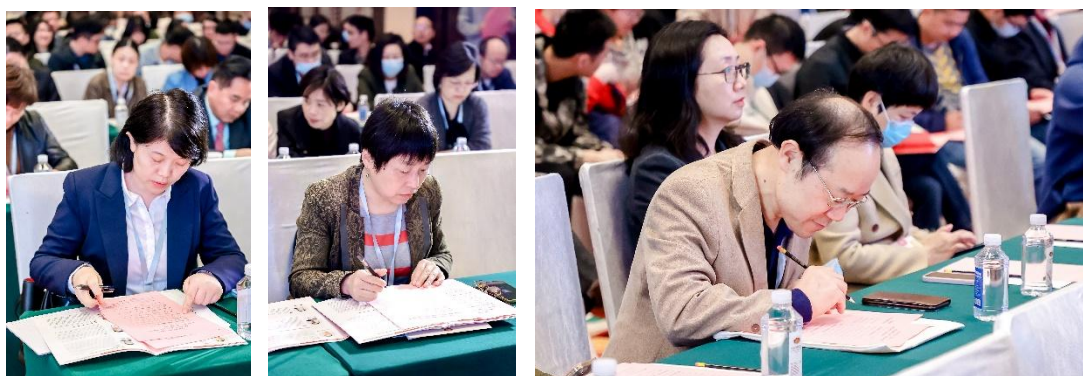
会员代表们行使无记名表决权