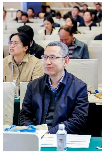
学术年会主旨报告（二）

随后，会议举行了会徽审议和荻硕贝肯-湖北省暨武汉免疫学会年度优秀学术成果竞赛活动颁奖仪式及闭幕仪式。